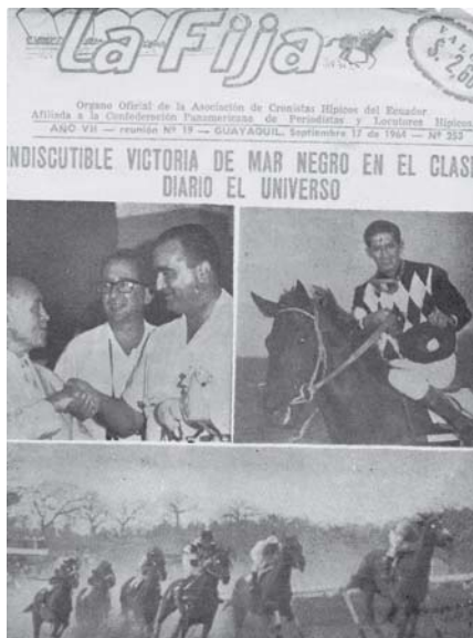
El ídolo de siempre Mar Negro

Nos duele Chile. Nos duelen los sueños olvidados de los golpeados por la naturaleza. Nos duelen las heridas de Tierra.