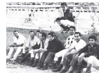
Grupo de jinetes en el hipódromo Santa Cecilia